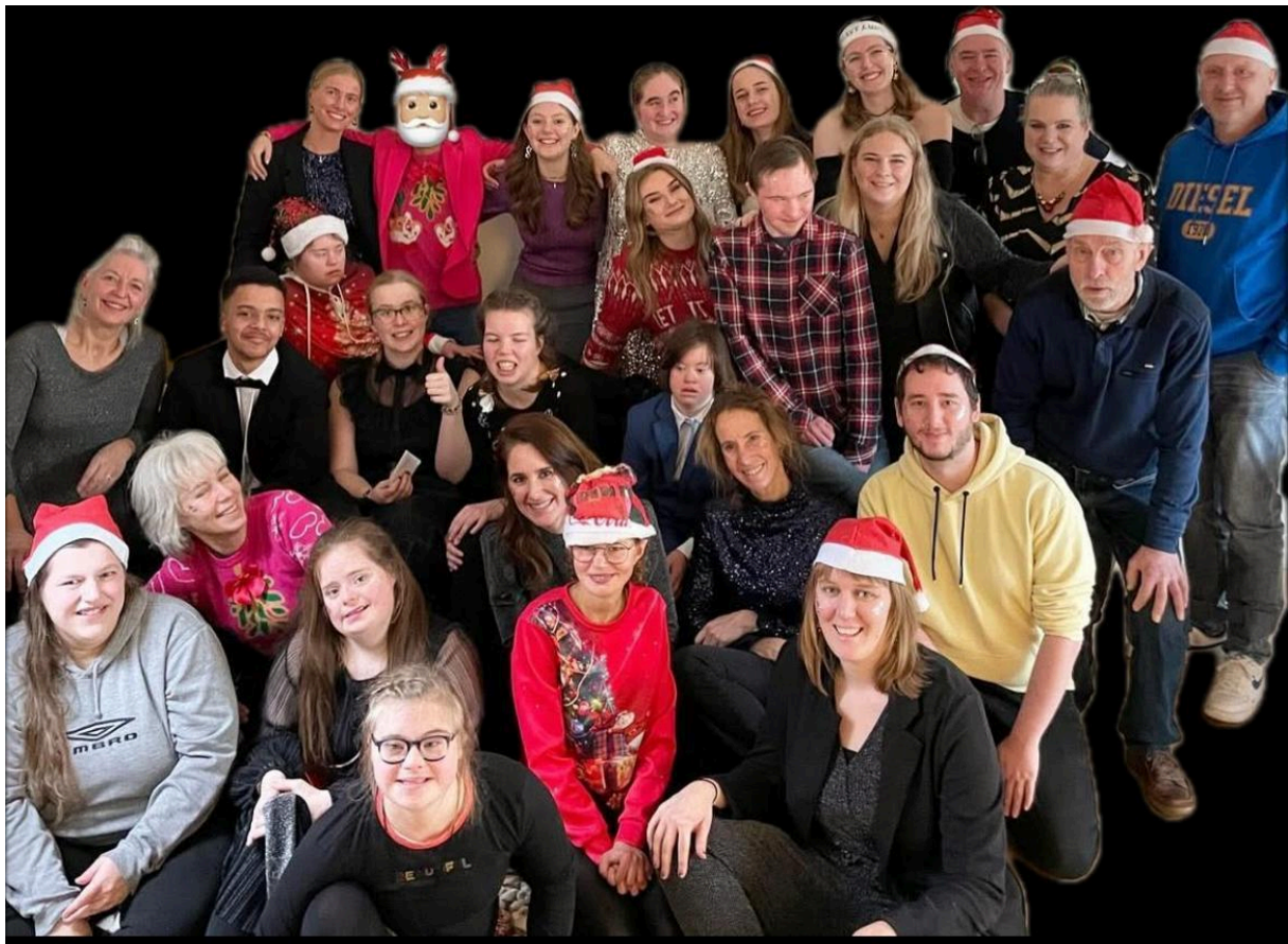
Kerstlunch Actieve dagbesteding 2024

We zullen in dit jaarverslag weer alle facetten met u doornemen en ook stilstaan bij het Benefietdiner. Dit diner met een veiling heeft Griftenstein & Zorg samen met Van der Valk georganiseerd om de Special Obstacle Run 2024 te financieren.