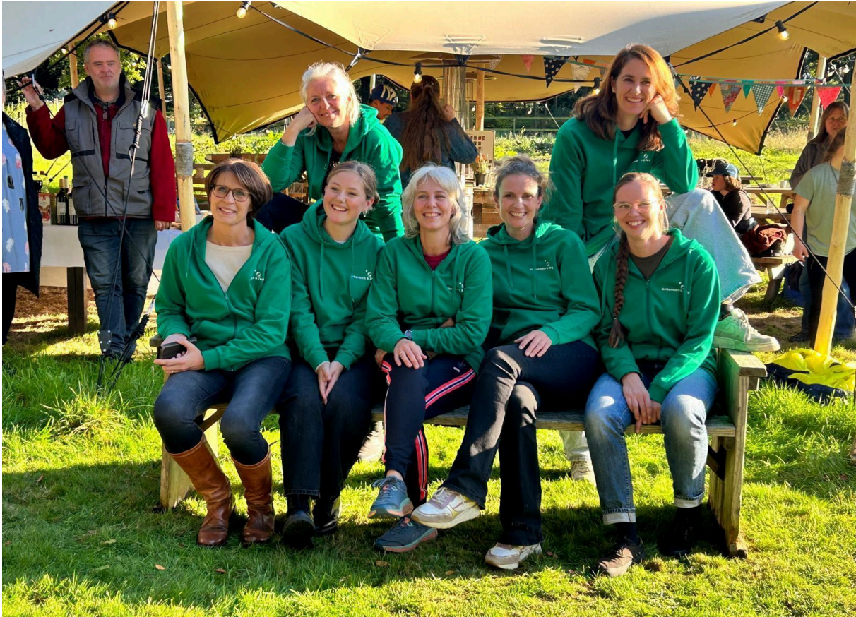
Presentatie nieuwe kleding tijdens de borrel met de ouders van de dagbesteding