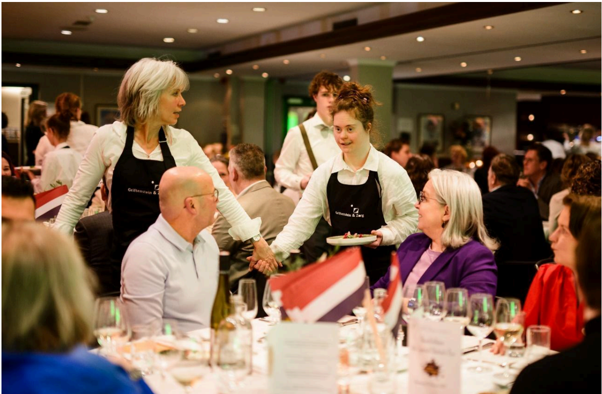
Bedienen tijdens het Benefietdiner