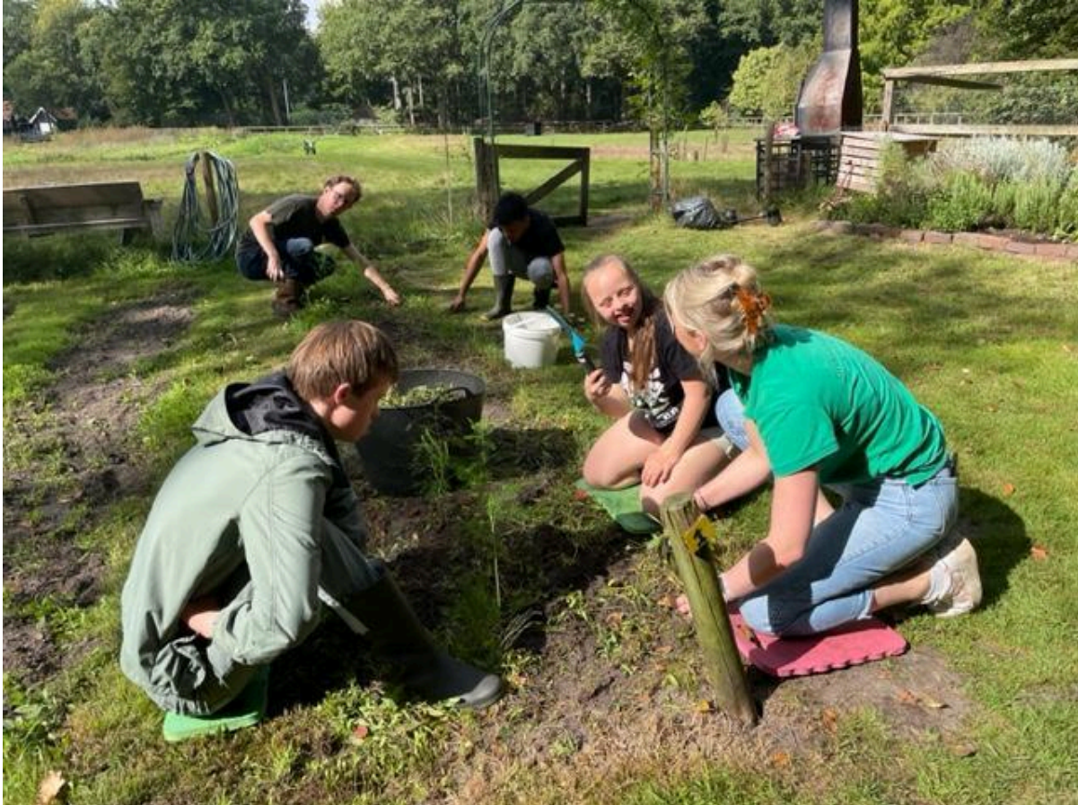
Samenwerken in de moestuin