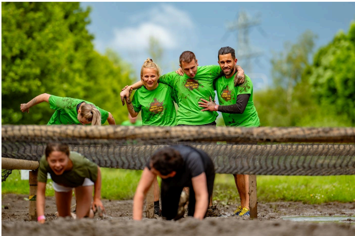
Obstacle Run 2024

De bus lijkt het nog even te doen. Wel wordt er al geld opzij gezet en denken we na hoe we zo'n grote investering kunnen bekostigen. En al doet de bus het nog goed, in de stad Utrecht (en andere gemeenten) is een milieuzone en zero-emissiezone ingesteld. Nu hebben we geen deelnemers hartje centrum maar het is wel een beperking.